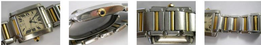
nach der bearbeitung