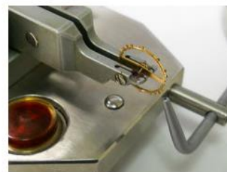
Auswuchten einer Unruh