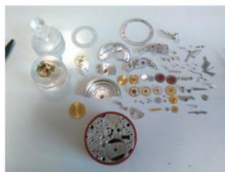
Revision eines Rolex Uhrwerkes