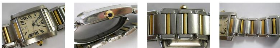
dopo la lavorazione