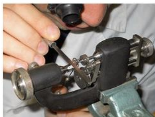
Rettifica di un perno

Inoltre ci piace coinvolgere nella riparazione il cliente dando la possibilità di assistere alla diagnosi del problema riscontrato sul proprio orologio e spiegando nel dettaglio il lavoro che svolgeremo.