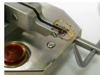
Equilibratura statica del bilanciere